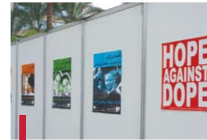
Sensibilisation sur les méfaits de la drogue.

En outre, des conférences ciblant les différentes catégories d'âge ont été proposées (tabagisme, drogue, etc.) et ont été suivies d'une séance de questions/réponses. Sur les lieux, les visiteurs ont pu passer gratuitement – et en toute confidentialité – le test du virus du SIDA, ainsi qu'un test de diabète. Les jeunes ont essayé la voiture Kunhady simulant l'effet d'une collision et l'importance du port de la ceinture de sécurité. Ils ont profité de la présence des nutritionnistes qui leur ont calculé leur BMI. Les personnes diabétiques ont pu bénéficier d'un test de glycémie ; les personnes tabagiques ont mesuré leur capacité respiratoire par la spirométrie, etc. Le succès de la foire a été tel que beaucoup ont souhaité qu'elle soit reprise à intervalles réguliers. Les partenaires ont relevé l'importance de cette activité pour leur région et la nécessité de développer davantage la collaboration entre le monde universitaire et la communauté locale.