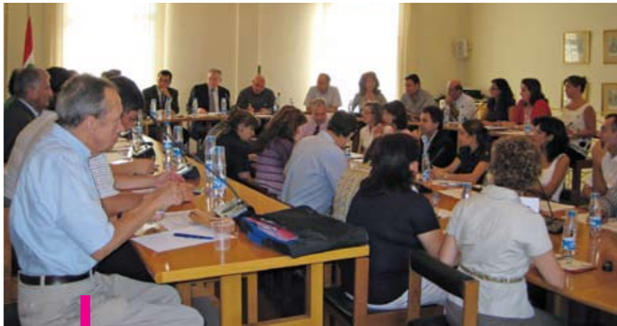
Chaque mois toutes les cellules, le comité de pilotage et le Recteur de l'USJ se réunissent pour une mise au point sur les activités de l'Opération 7 e jour.