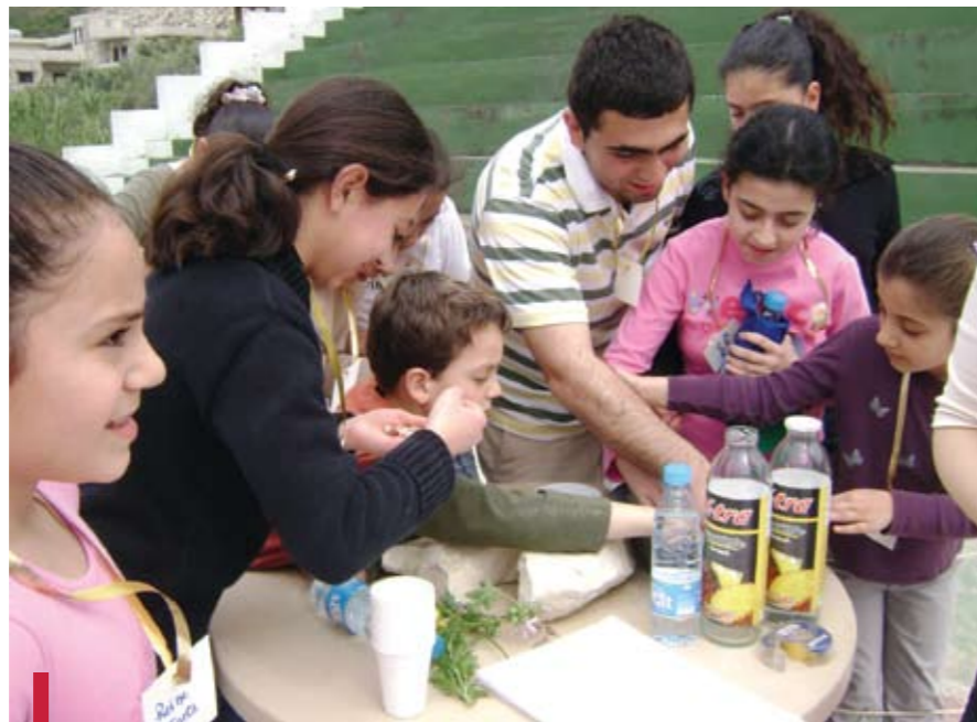
La joie de partager ensemble une activité de loisirs.

Les étudiants des trois années de plusieurs filières dont des assistants sociaux, animateurs sociaux, éducateurs spécialisés de l'École libanaise de formation sociale (ELFS), des responsables pédagogiques, la directrice, des formateurs et professionnels de l'action sociale se sont engagés pour reconstruire le lien social dans le village de Hajjé près de Saida au Liban sud. Si le village de Hajjé a été retenu, c'est que lors des bombardements israéliens en juillet 2006, le pont de Hajjé a été le premier