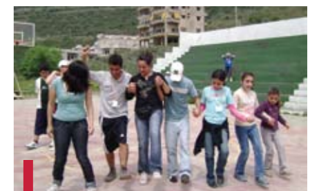
Apprentissage de la dabké : patrimoine culturel à sauvegarder.