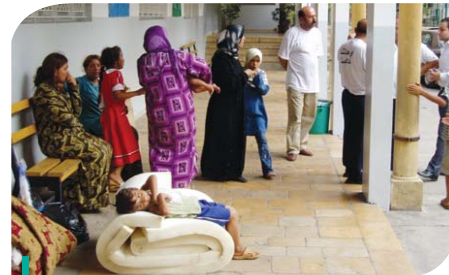
Des personnes déplacées réfugiées dans le Campus des sciences médicales de l'USJ.

Ce défi, à l'instar de tant d'autres organisations informelles avant elles, l'Opération 7 e jour a dû le relever assez rapidement. Dès la mi-août 2006, au terme d'une guerre courte mais dévastatrice de 33 jours, un changement majeur survient : le retour massif dans leurs villes et villages des populations poussées à l'exode. Les responsables des opérations d'assistance, organisés en « groupes », sont surpris par cette mobilité extrême de la population et la perte de tous les contacts réalisés durant les semaines précédentes. L'action de l'université a dû s'adapter à ce changement : structuration, changement de groupe à « cellule », nomination d'un responsable et rédaction d'un énoncé som-