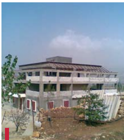
Centre d'accueil à Tarchiche.

Le « Projet d'avenir : Tarchiche 2010 » fait partie du grand chantier d'engagement civil qu'est l'Opération 7 e Jour.