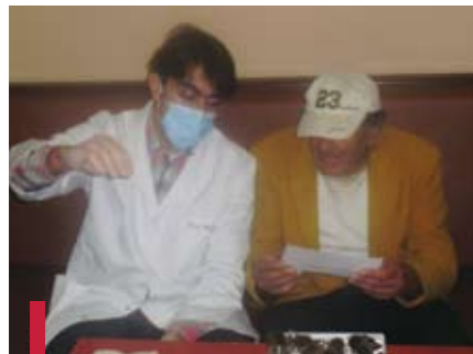
L'USJ dans un resto du cœur.

Un dépistage des maladies bucco-dentaires a eu lieu dans un resto du cœur à Achrafieh à une centaine de personnes du troisième âge. Ces dernières ont aussi assisté à la projection d'un film sur la prévention dentaire et ont reçu des échantillons de produits d'hygiène dentaire.