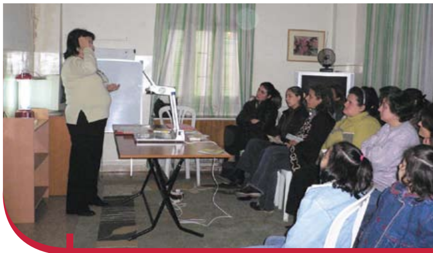
Des étudiantes écoutant avec intérêt les conseils de la diététicienne du Centre.

Le CUSFC a aussi animé une série de rencontres avec un groupe de mères au dispensaire « Roueissat », sur la prévention des accidents domestiques.