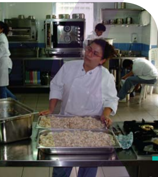
Dans les cuisines de l'USJ.

Juillet 2006, la guerre éclate au Liban ; le sud du pays est vidé de sa population. L'Université Saint-Joseph prend rapidement conscience de l'impérieuse nécessité de se mobiliser. C'est l'Opération 7 e jour. Des cellules d'activités sont constituées pour aider une population écrasée par le malheur. Une opération qui dure et perdure... Flash-back.