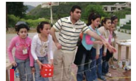
Animation sociale avec des adolescents du village de Hajjé.

mier et second semestre des années universitaires 2006-2007, 2007-2008 et 2008-2009 ; elles ont eu lieu dans les locaux de l'ELFS (Campus des sciences médicales, Beyrouth), au CEULN (au Liban Nord), au CEULS (Liban Sud), au CEUZB (Zahlé/Bekaa). Ces formations traitent de la question du travail humanitaire en temps de crise : notamment sur la solidarité internationale, l'intervention dans les situations de crise et d'urgence : la planification, et l'organisation des ressources humaines et matérielles, stratégies, enjeux, impacts, retombées ; elles sont utiles pour habiliter plusieurs acteurs sociaux, dans les différentes régions libanaises à faire face à diverses situations de guerre ou d'émeutes ou de sinistres naturels (incendies, séismes, inondations, etc.)