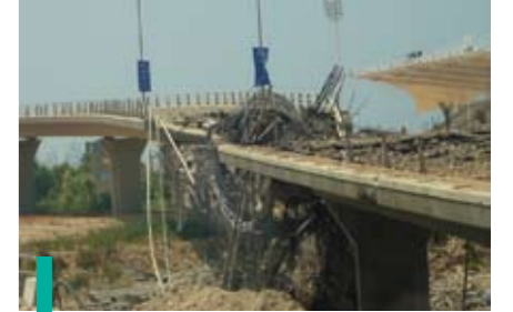
Les destructions causées par la guerre.

maire de la mission pour chaque cellule, élaboration d'une liste d'actions prévues et augmentation du nombre des cellules pour répondre aux nouveaux besoins apparus, notamment dans le domaine de la reconstruction, du génie civil, de l'environnement, de l'hygiène.