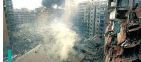
Des bâtiments en ruine.

C'est sous les bombes que l'Opération 7 e jour (six jours pour travailler, un jour pour donner), est née. L'Université ne pouvait rester indifférente à la souffrance qui submer-