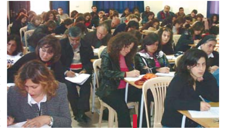
Une formation de religion chrétienne.

L'Institut supérieur des sciences religieuses (ISSR) a démarré, en novembre 2006, un centre de formation religieuse pour adultes à Aïn Ebel, où une formation de religion chrétienne est assurée. Ce cycle de formation s'étend sur trois ans. Il est assuré en partenariat avec les diocèses catholiques de Tyr et du Sud en général, et en collaboration avec le Collège des sœurs des Saints-Cœurs à Aïn Ebel. Cette formation est donnée aux acteurs pastoraux de la région, qui comprend notamment les villages de Debl, Aïn-Ebel, Rmeich, Kawzah et Alma el-Chaab. Elle doit les conduire vers une foi réfléchie qui leur permettra de mieux s'engager religieusement et socialement. La formation est assurée avec l'aide de toute la communauté de l'ISSR - enseignants, étudiants et anciens -. Les cours, qui ont commencé en novembre 2006, sont donnés chaque troisième samedi du mois, sur une période de trois ans.