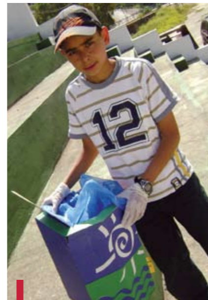
Invitation à une éducation à l'hygiène publique.

Durant un an, direction et responsables pédagogiques ont effectué des visites