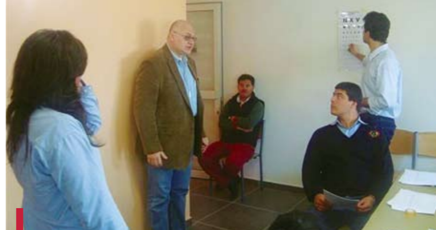
Visites médicales dans une école privée de Baskinta.