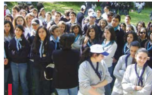
Les élèves attendant les résultats du rallye.

Avec la collaboration de la Cellule Dialogue et de la Pastorale Universitaire du centre d'études universitaires de Zahlé et de la Békaa (CEUZB), la Cellule Citoyenneté et engagement étudiant a organisé une journée « prévention contre la drogue » le 30 avril 2009 au couvent de Taanayel des Pères jésuites, dans la Békaa.