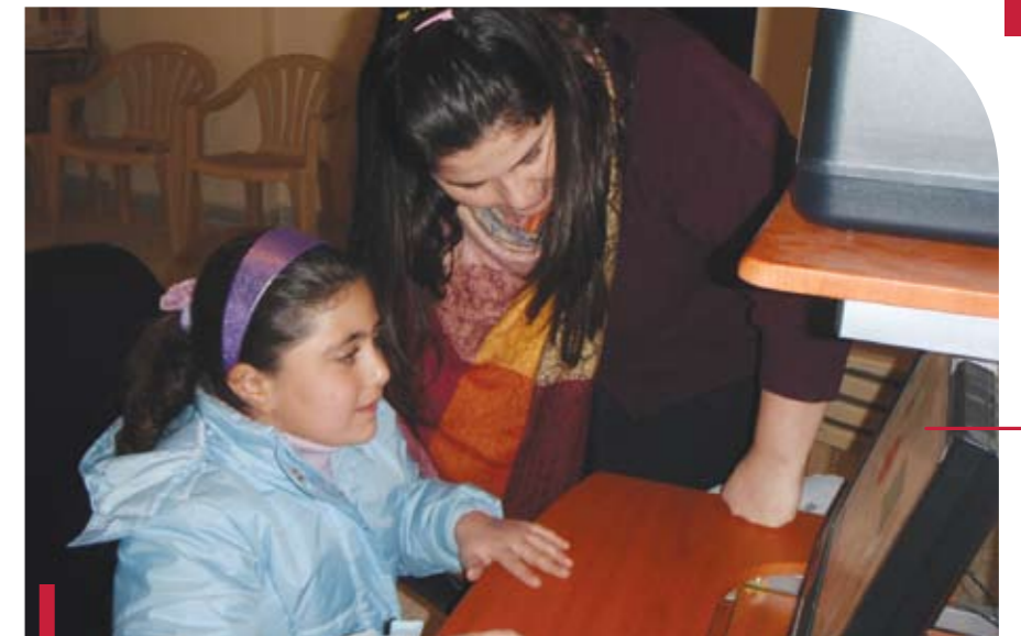
Une formation individuelle.

En vue d'améliorer la vie éducative et culturelle de la localité de Cana, la Cellule Citoyenneté et engagement étudiant a installé une salle informatique, et offert une session de formation en Word, Excel, PowerPoint et Paint, à la paroisse Saint-Georges de Cana. La session était destinée aux épouses ne travaillant pas et aux enfants âgés de 5 à 12 ans. Elle a été donnée à trois reprises, les 18 octobre 2008, puis les 7 et 31 janvier 2009. Le projet a été réalisé avec le concours des étudiants de la Faculté des sciences infirmières (Beyrouth et Sud) et les étudiants de l'Ecole de traducteurs et d'interprètes de Beyrouth (ETIB).