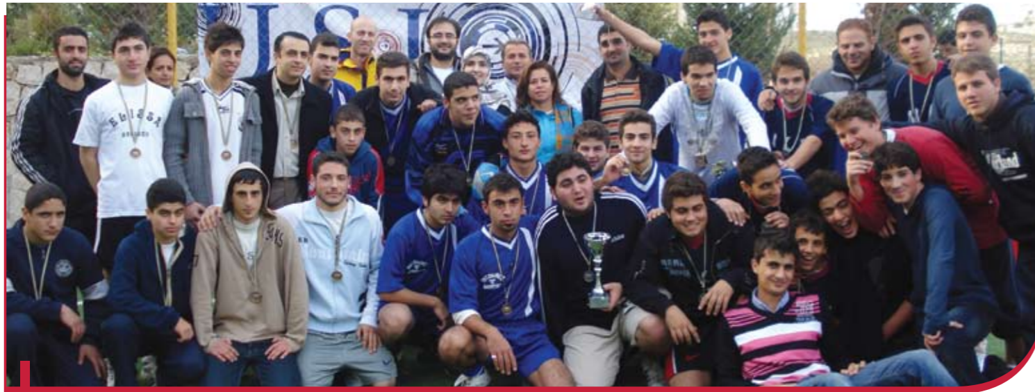
L'équipe du Service du sport de l'USJ et les participants des écoles.