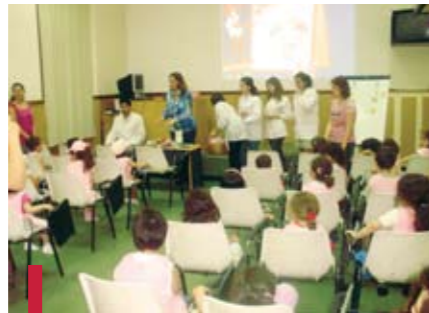
Formation sur l'hygiène bucco-dentaire.

Dans le cadre de la santé scolaire, le service de Dentisterie Pédiatrique et Communautaire de la Faculté de