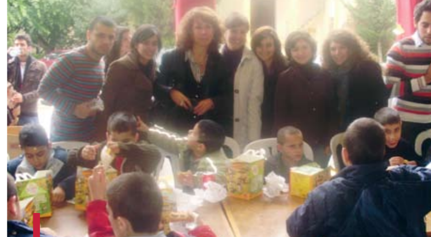
Fête à Noël regroupant des enfants de niveau socio-économique modéré.