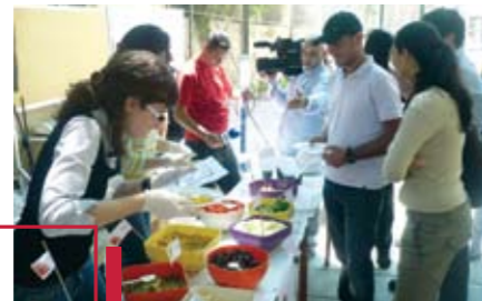
Salad Bar : mélange de richesse et de diversité.

Pour finir, les étudiants ont participé au jeu dit « Salad Bar », dont le principe consiste à choisir, comme pour une salade, des citations sur le dialogue et la diversité. De quoi confec-