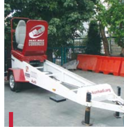
Stand de l'association Kunhady.

La Foire comprenait une quarantaine de stands regroupés par thème : santé des femmes (cancer du col, cancer du sein, contraception, ostéoporose) ; santé des jeunes (alimentation, difficulté scolaire, maux de dos, sécurité routière, soins de secours) ; santé des personnes âgées (activité physique, hygiène dentaire, régime et alimentation, troubles de la mémoire) ; santé des personnes diabétiques (alimentation et life style) ; santé des personnes cardiaques (alimentation, life style) ; santé et handicap (habitudes de vie, handicap physique et mode de vie) ; santé et sécurité des familles (drogue, dysfonctions, gingivite, intoxication,