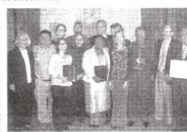
La cérémonie de remise des prix s'est déroulée à Talloires (France).

L'Université Saint-Joseph figure parmi les lauréats de la première édition du prix annuel de la Fondation MacJannet et du Réseau Talloires pour la citoyenneté mondiale, a annoncé PUSJ dans un communiqué. L'USJ a en effet reçu le 6 juin le second prix de la Fondation, pour «Opération 7e jours». La cérémonie de remise des prix a eu lieu à Talloires (France). Ce second prix, à savoir la somme de 2500 dollars, a été obtenu par PUSJ ex-aequo avec l'Université du Cap en Afrique du Sud. Le premier prix (5 000 dollars) a été attribué à l'Université Aga Khan au Pakistan, et le troisième à l'Université américaine du Caire.