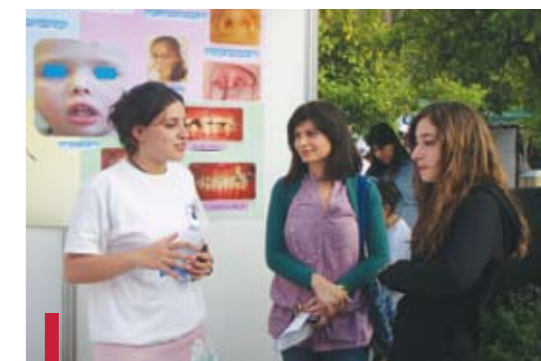
Stand pour les maladies dentaires.