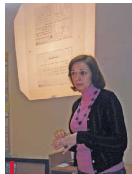
Une médaille d'honneur a été décernée au centre lors de la clôture des activités du Lions International.

ont permis de confirmer la nécessité d'une prise en charge orthophonique pour trois d'entre elles, qui présentent des troubles spécifiques de l'apprentissage ; ils ont été communiqués à la religieuse responsable. Un éclaircissement pour une meilleure orientation orthophonique et scolaire a été proposé.