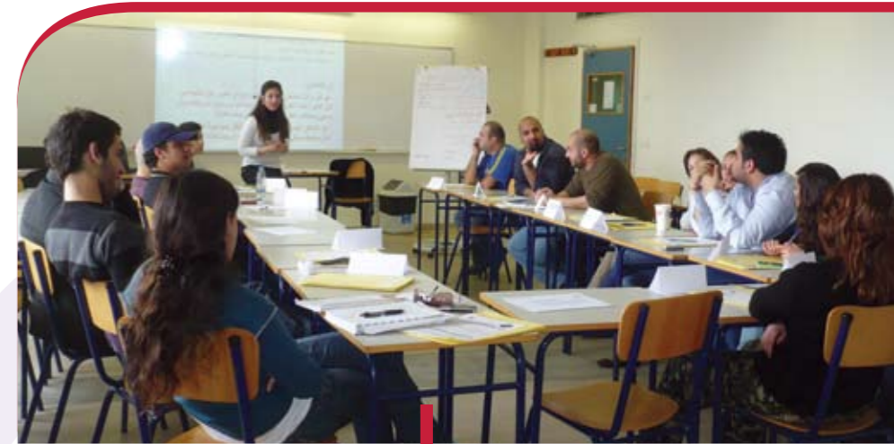
Ateliers de formation à la citoyenneté assurés par la Faculté des sciences de l'éducation aux jeunes moniteurs de l'association Offre Joie.

Dans le cadre du cours « Management des établissements scolaires », du Master Gestion scolaire de la Faculté des sciences de l'éducation, 18 étudiants de la Faculté ont assuré des prestations à un collège de Beyrouth.