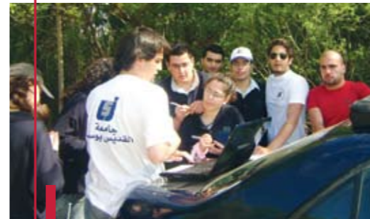
Les étudiants expliquant les méfaits de la drogue.

Pour clôturer l'événement un concert a été donné par la chorale de l'USJ.