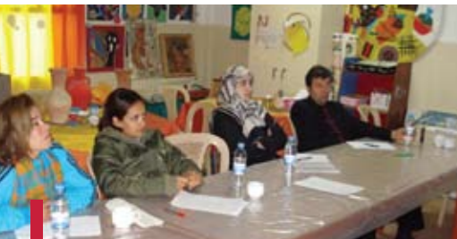
Formation adressée aux enseignants d'éducation physique des écoles.