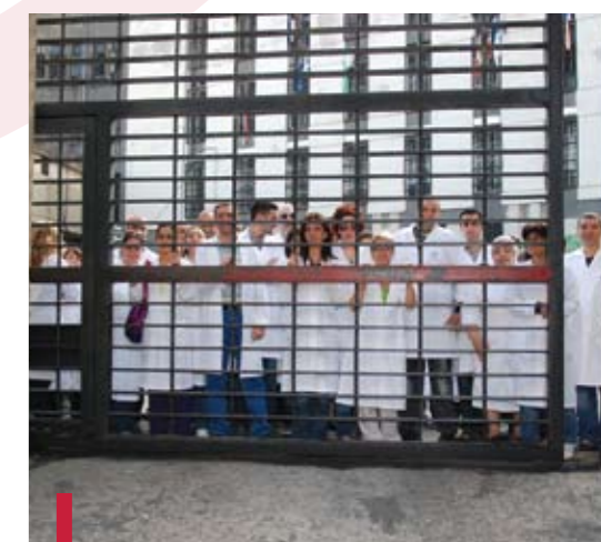
L'HDF dans la prison de Roumieh.

matologique et gynéco-obstétricale auprès de tous les mineurs de la prison de Roumieh, une mission pédiatrique auprès de tous les mineurs de la correctionnelle de Fanar et une mission gynéco-obstétricale et dermatologique auprès de toutes les femmes incarcérées à la prison de Tripoli. Les missions dans les prisons ont compris en plus des consultations médicales, des examens de sang pour dépister l'hépatite B, l'hépatite C, le HIV, l'anémie, des intradermoréactions pour dépister la tuberculose ainsi que la distribution de kits d'hygiène à tous les prisonniers.