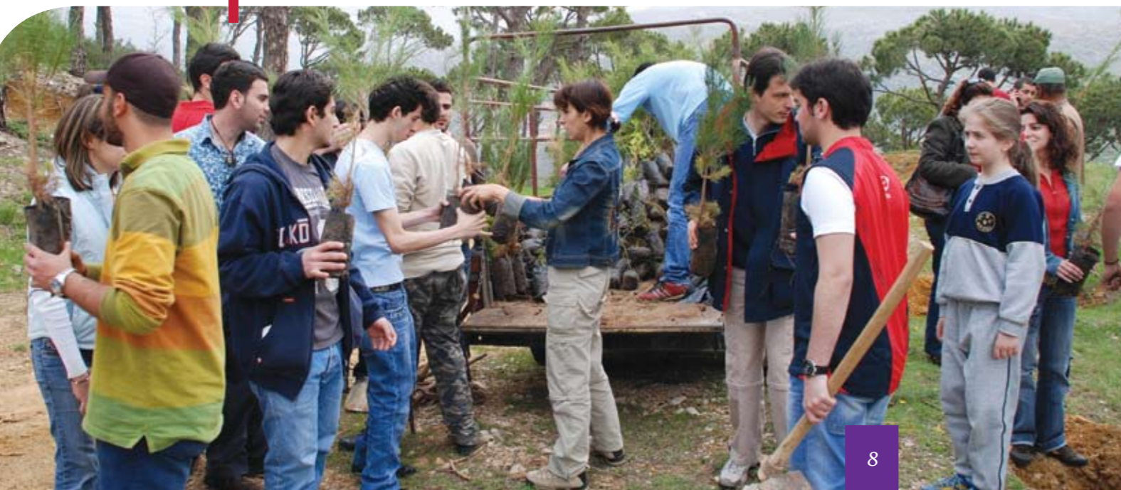
Des étudiants bénévoles reboisent.