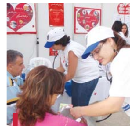
Tests pour les maladies cardio-vasculaires.