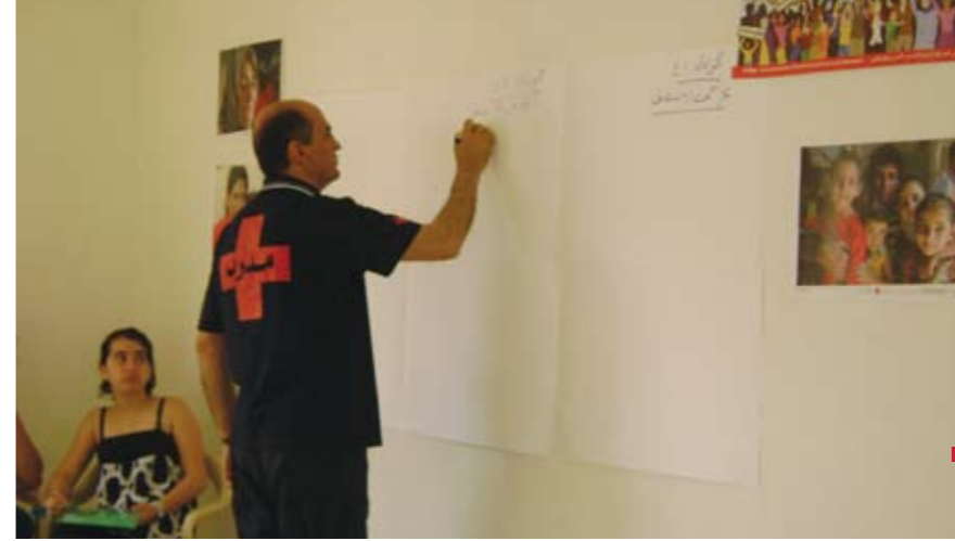
Session de formation avec la Croix Rouge Libanaise aux premiers secours et les mesures d'urgence.

à être détruit par l'aviation provoquant beaucoup de dégâts dans le village. Ce projet a été réalisé entre février et juin 2008 et entre février et juin 2009, en partenariat avec les représentants des leaders locaux : la paroisse, la municipalité, le club socioculturel du village, la mission pontificale à Jal el Dib. Ce projet cible toute la population du village de Hajjé (plus de 4.000 habitants) et plus particulièrement les femmes au foyer, les jeunes au chômage et les adolescents de 12 à 18 ans. Ce projet consiste à étudier les besoins des habitants, à dégager avec eux les priorités, à mettre en place un plan d'action social à moyen et long terme et à former les jeunes cadres bénévoles au travail de groupe.