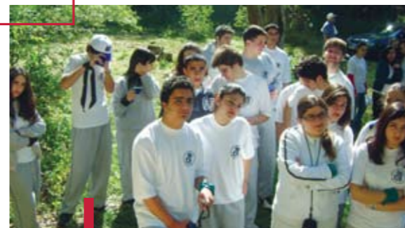
Explication du jeu.