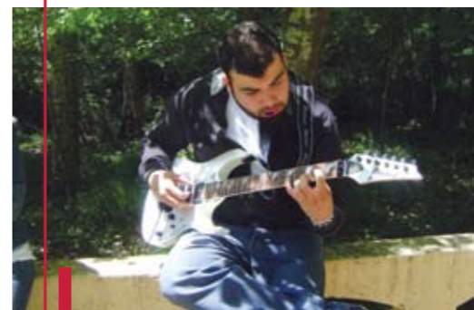
Un talent à explorer.