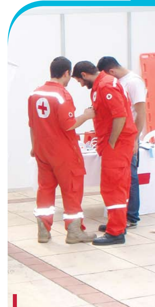
La Croix Rouge était aussi sur place !