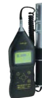
Analyseur de poussière.

Ces appareils auront pour capacité d'analyser des polluants à savoir les particules en suspension (TSP, PM10, PM2.5), les composés organiques volatils (COV), les gaz. De plus, ils sont équipés des capteurs météorologiques pour mesurer la température, la pression, l'humidité et la vitesse du vent.