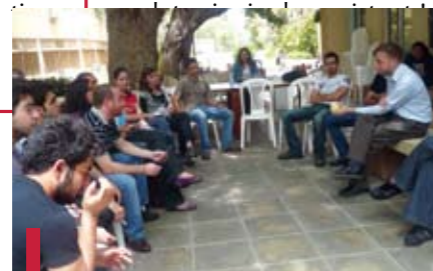
Rencontre animée sur «Ikhtilaf Bidoune Khilaf».