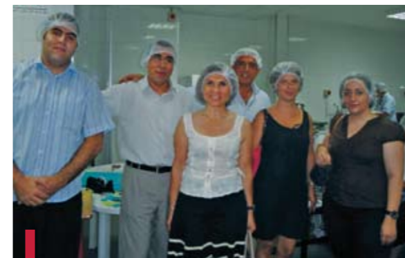
La Cellule de Gestion et le comité de pilotage visitent l'usine de fabrication de petits-fours de Ahlouna.

La Cellule de Gestion (Faculté de gestion et de management) a participé à la réorganisation administrative de l'association « Ahlouna ». À savoir : la révision des statuts, la formation des vendeurs, les règlements internes de l'association ainsi qu'une étude de marché. Mais elle a aussi apporté une assistance au niveau de la réorganisation du travail à la cuisine de leur usine ; elle a donné des séminaires de formation au niveau du service clientèle et a développé une marque et une gamme de produits pour élargir les activités de « Ahlouna » et la distribution de ses produits sur tout le territoire. Elle a finalement effectué des tests de vente à Beyrouth dans un point de vente sélectionné.