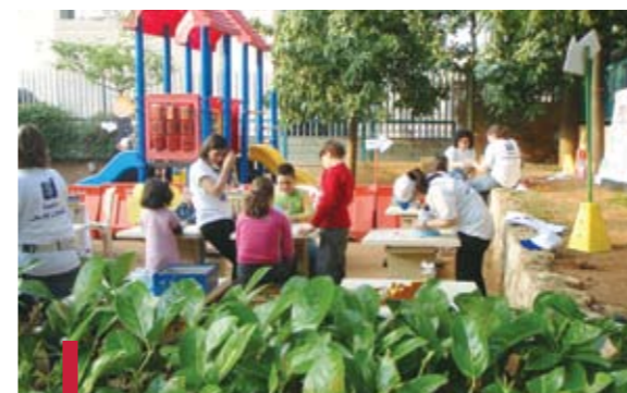
Activités avec les enfants.

Le succès de la Foire a été considérable. Outre la population, tous âges confondus, la foire a attiré diverses écoles, qui y ont envoyé des élèves de tous les cycles (primaire, complémentaire et secondaire). Des circuits répondant aux besoins précis de ces écoles ont été organisés.