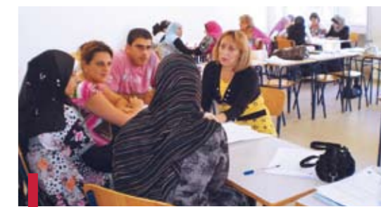
Dans le cadre d'une formation.

Le deuxième volet est la conception de manuels scolaires pour les trois classes du préscolaire (un par niveau) ainsi qu'un guide du Maître pour faciliter l'utilisation. Une équipe de six personnes, formée par des enseignants et des anciens de l'ILE travaille sur la conception de ces ouvrages, qui comprendront chacun neuf thèmes (objectifs d'enseignements, activités et exercices types inclus). Ces thèmes sont « testés » sur le terrain, dans une école, et subissent des réajustements nécessaires dont le besoin se fait sentir. Toutes les productions seront publiées au nom de l'ILE, de l'UNRWA et de l'UNICEF. Une formation sera proposée ultérieurement pour habiliter les enseignants à l'utilisation de ces manuels.