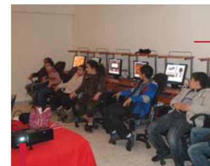
Formation en Word.

La Cellule a également aménagé une bibliothèque au village de Krayyeh, en offrant des livres et logiciels.