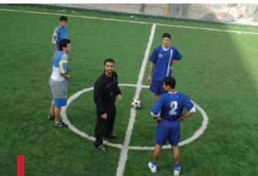
Tournoi de mini football.