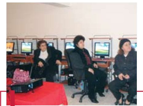
Dans le cadre d'une formation.

En vue d'améliorer la vie éducative et culturelle de la localité de Cana, la Cellule Citoyenneté et engagement étudiant a installé une salle informatique, et offert une session de formation en Word, Excel, PowerPoint et Paint, à la paroisse Saint-Georges de Cana. La session était destinée aux épouses ne travaillant pas et aux enfants âgés de 5 à 12 ans. Elle a été donnée à trois reprises, les 18 octobre 2008, puis les 7 et 31 janvier 2009. Le projet a été réalisé avec le concours des étudiants de la Faculté des sciences infirmières (Beyrouth et Sud) et les étudiants de l'Ecole de traducteurs et d'interprètes de Beyrouth (ETIB).