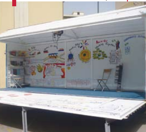
La caravane montrant les activités sur le Campus.

Building Reconciliation 2 e partie (YBR II) cherchait à établir un modèle positif de gestion de la diversité au Liban entre les jeunes de différentes religion, appartenance politique et classes sociales.