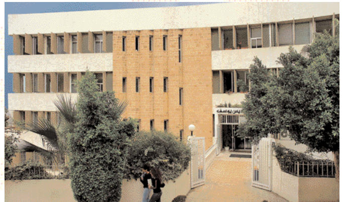
مراكز الدروس الجامعية في المناطق