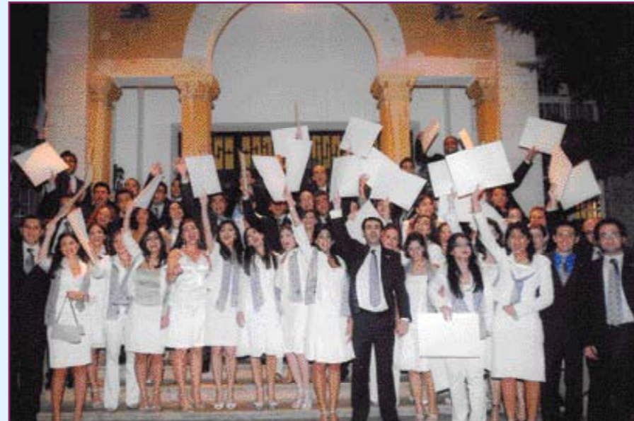
Campus des sciences médicales, rue de Damas B.P. 11-5076 Riad el Solh, Beyrouth 1107 2180 - Liban Tél : 01-421000 ext. 2200, Tpic : 01-421020 Courriel : csm@usj.edu.lb

Le jury, établit les listes d'admis en tenant compte des classements des candidats et de leurs candidatures prioritaires. Ces listes sont affichées dans chaque institution et seront disponibles sur le site de l'USJ www.usj.edu.lb à la date précisée sur la feuille annexe.