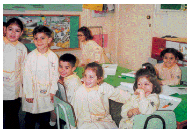
L'Éducateur au préscolaire et primaire assure les conditions optimales de l'apprentissage

Il est composé de matières obligatoires disciplinaires (75%), de matières optionnelles fermées (20%) et d'optionnelles ouvertes (5%).