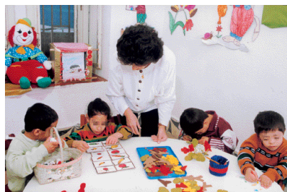
L'orthopédagogue accompagne l'enfant et le groupe dans son parcours et son projet

Détenteurs du master ou du doctorat, ils peuvent occuper des postes de conseillers pédagogiques, de consultants ayant leur propre cabinet ou de planificateurs de méthodes et de programmes spéciaux. Ils peuvent aussi se consacrer à l'enseignement universitaire et à la recherche.