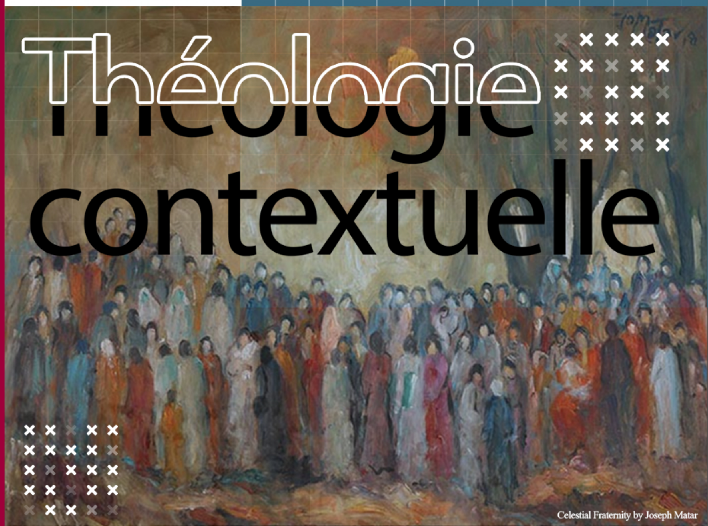
Celestial Fraternity by Joseph Matar