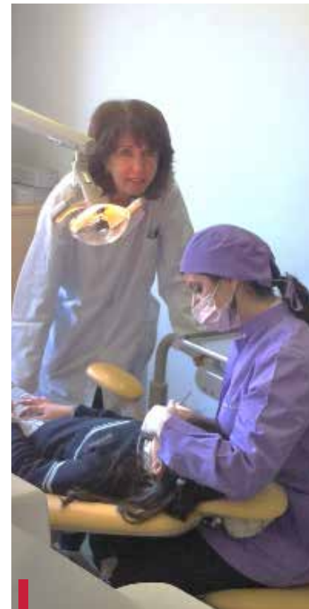
École de Kfarnabrakh - arcenciel.