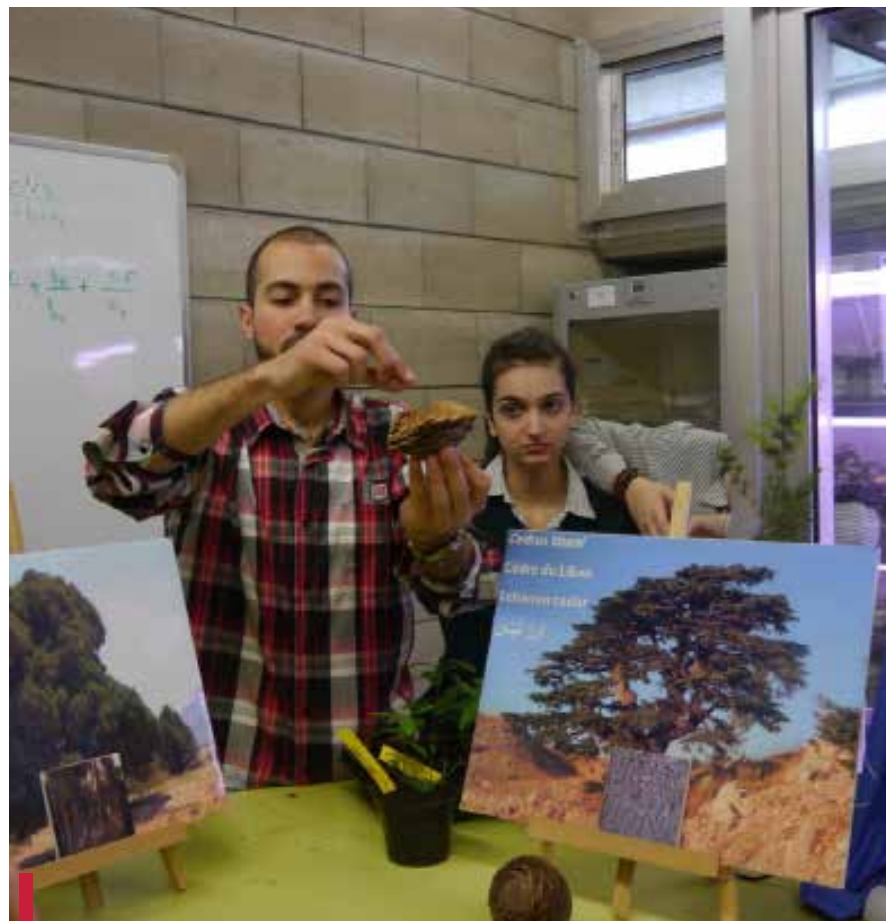
Sauvetage d'une plante endémique du Liban l'astragalus.

le cadre de l'O7, des étudiants de la Faculté des sciences de l'USJ ont commencé cette opération de sauvetage en mai 2012. Le premier individu de cette plante a été transféré vers un lieu écologiquement équivalent à son milieu d'origine : le jardin botanique du Campus des sciences médicales de l'USJ.