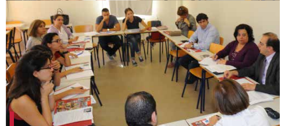
Ateliers de réflexion.

Ces projets, comme tous les projets des cellules évoluent jour après jour pour essayer de mener à une approche de développement qui pourrait aboutir à des changements permanents au niveau de la formation de l'« étudiant-professionnel-citoyen » au sein de l'USJ comme au niveau de la population ciblée par cette opération ●