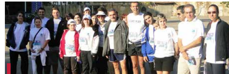
Au cours du marathon.

Une cinquantaine de personnes de l'USJ ont participé, dans le cadre de l'O7, au marathon de Beyrouth qui s'est tenu le 27 novembre 2011. La Cellule sport a collecté à partir des frais d'inscription au marathon la somme de 460 000 LL qu'elle a offert à l'O7.