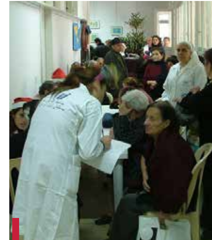
Mission Noël - décembre 2011.

De même, l'Hôtel-Dieu de France (HDF) a sponsorisé, le 22 décembre 2011, un déjeuner au centre social pour 135 personnes âgées auxquelles des couvertures en laine ont été distribuées.