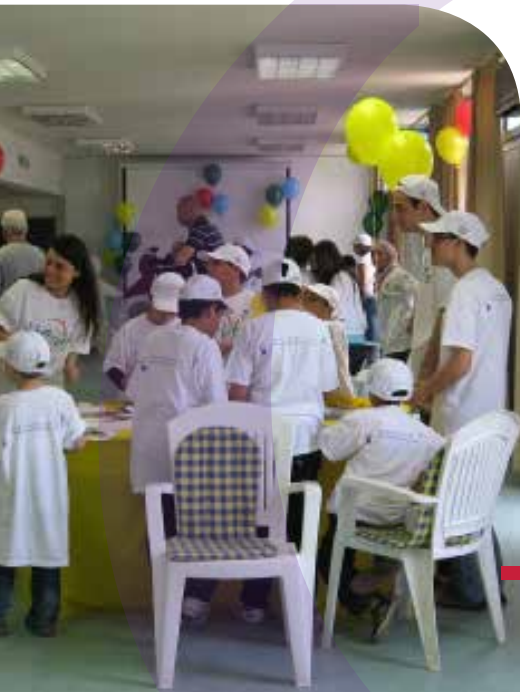
Activités avec l'Association libanaise de l'hémophilie.

De 2006 à 2009 avec Offre-Joie, Caritas, World vision, CCFD, CRS et L'AFEL : une formation à l'intervention sociale en situation d'urgence.