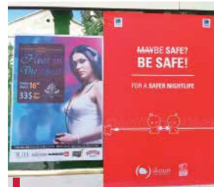
Des posters ont été affichés dans tous les campus de l'USJ.

dans les différents campus de l'USJ. La première activité a eu lieu le 16 mars 2012 à l'occasion de la fête de Saint-Joseph. Durant la soirée organisée par les amicales de l'USJ, les éducateurs de pairs ont planifié et exécuté une campagne de sensibilisation aux addictions auprès de 1000 étudiants de l'USJ. Des centaines de brochures et de posters sur le thème « BeSafe » ont été distribués aux personnes présentes.