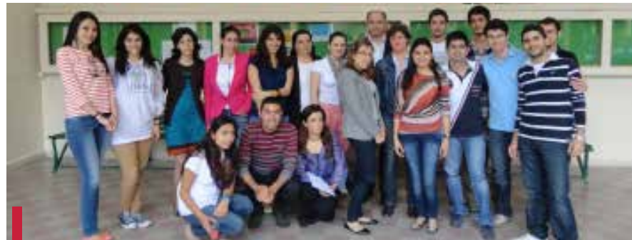
Distribution des certificats aux étudiants.

Par ailleurs, en collaboration avec la Faculté de médecine et dans le cadre d'un partenariat entre l'ONG Skoun et l'O7, un projet intitulé « un espace de dialogue entre les jeunes sur les drogues et les addictions » a vu le jour. L'objectif de cette initiative étant de créer un réseau de jeunes universitaires qui jouent le rôle d'éducateurs de pairs dans la sensibilisation de