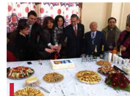
Célébration du partenariat entre la FMD et l'association Karagheusian.