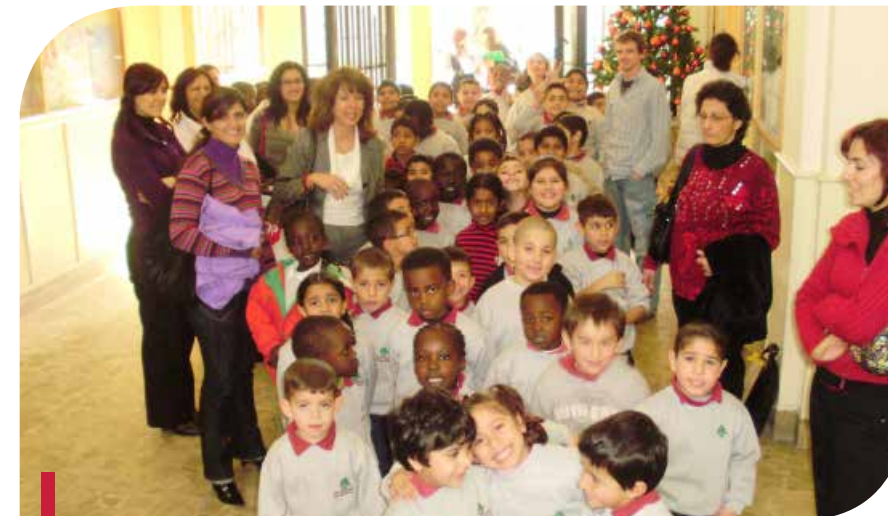
Enfants de l'association Dar al Awlad.

- Soins dentaires permanents dans le dispensaire de l'association avec l'Ordre des dentistes de Beyrouth qui a offert le matériel et les produits d'hygiène dentaire et l'ONG arcenciel qui a organisé et financé le projet. - Promotion de la santé bucco-dentaire avec la municipalité de Ghobeiri qui a organisé le projet.