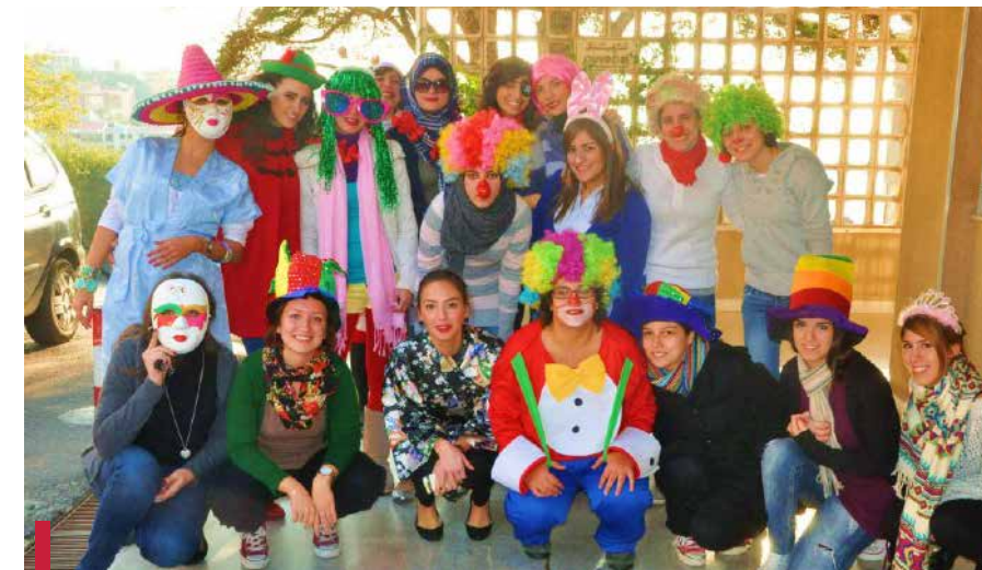
Sainte-Barbe à l'hôpital de la Croix.

L'Institut supérieur d'orthophonie (ISO) s'est engagé, cette année, auprès de l'Association libanaise des chevaliers de Malte avec une trentaine d'étudiantes bénévoles qui se sont mobilisées pour le bien-être des personnes dont s'occupe l'association. En effet, l'Association libanaise des chevaliers de Malte a pour objectif de répandre le partage et la dignité, tout en améliorant le bien-être du pauvre et du malade au sein de la société, et de perpétuer l'action de l'Ordre de Malte au Liban. Les activités sont initiées, organisées et mises en œuvre par une équipe de jeunes libanais dynamiques, de toutes confessions, affiliés à l'Association, sachant que des volontaires étrangers participent également à certaines activités. Celles-ci concernent les enfants défavorisés, les personnes handicapées et les personnes âgées. Des étudiantes en 1 ère , 2 e , 3 e et 4 e année