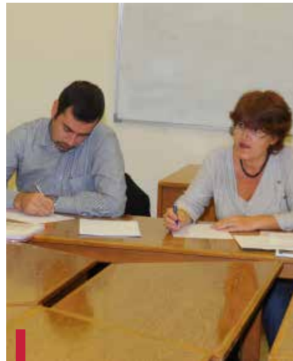
Atelier de réflexion.

Par ailleurs, les participants se sont retrouvés autour d'un buffet dans le jardin du Campus des sciences médi-