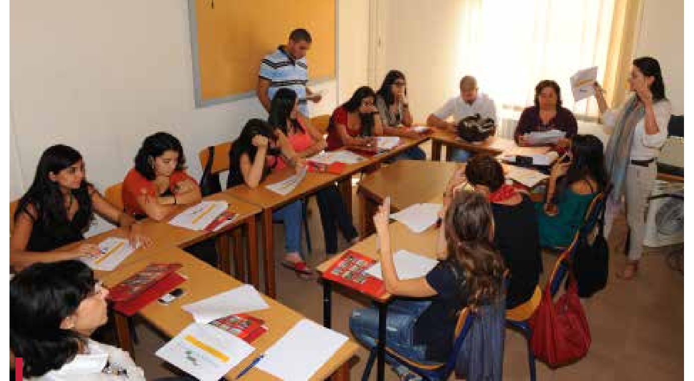
Atelier de réflexion sur la façon de sensibiliser et impliquer les étudiants dans les activités de l'O7.