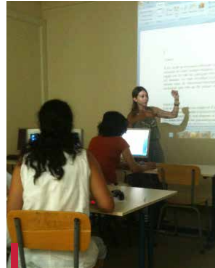
Formation bénévole en informatique.

Paniers rouges – Noël 2011 La FSE a lancé en décembre 2011, en collaboration avec l'amicale de la