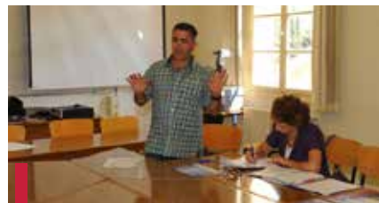
Mise en commun des différentes ONGs.

Dans les rapports de synthèse des ateliers portant sur les quatre autres questions, les réponses sont les suivantes :