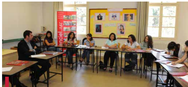
Mise en commun des différentes ONGs qui voudraient travailler en partenariat avec l'O7.