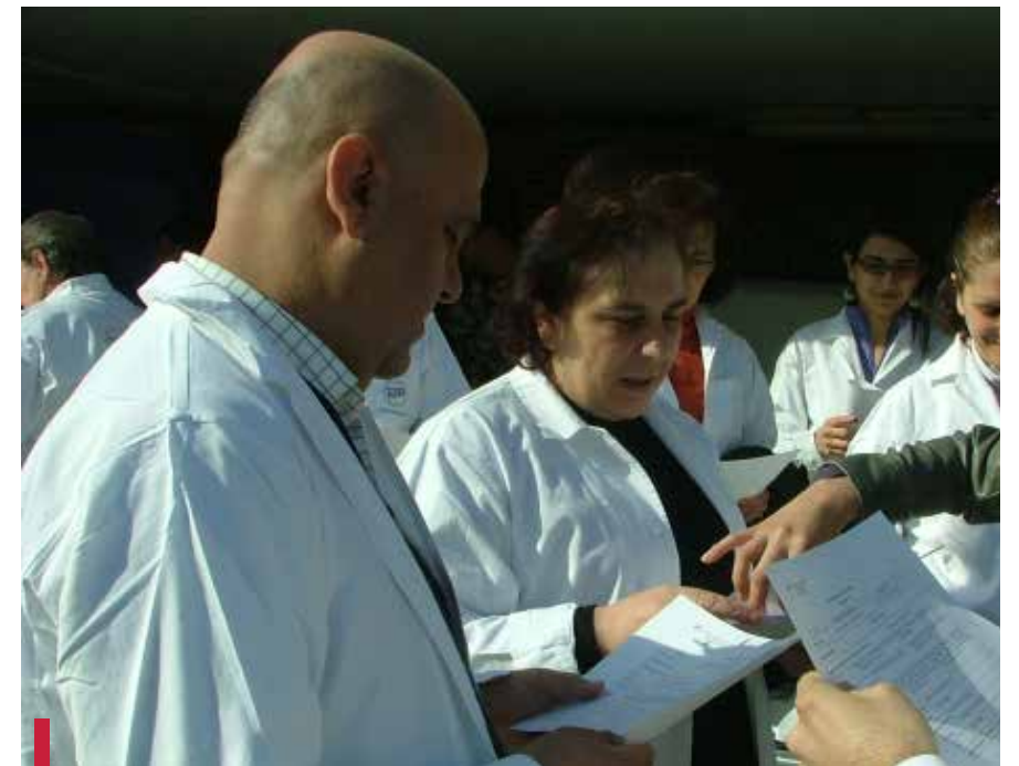
Prison Adlieh - mars 2012.

Le 24 mars 2012, 48 volontaires ont participé à une mission de médecine générale et de gynéco-obstétrique à la prison des émigrés à Adlieh. Cette prison reçoit des émigrés qui ont des problèmes de séjour. Durant la mission, 111 personnes ont bénéficié de consultations de médecine générale et de cardiologie et 54 femmes ont bénéficié d'une consultation de gynéco-obstétrique. Des tests de dépistage du virus du SIDA et de l'hépatite B ainsi qu'une IDR ont été effectués pour 150 détenus. Des médicaments ont été remis aux infirmières du dispensaire de la prison. De même, des produits d'hygiène de base (serviettes, savons, shampoings, déodorants, brosses à dents, dentifrices et serviettes hygiéniques), des sous-vêtements et des survêtements ont été livrés aux assistantes sociales de Caritas qui ont pris en charge la distribution aux détenus.