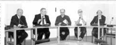
La séance de signature de l'accord-cadre entre l'USJ et arancelci.