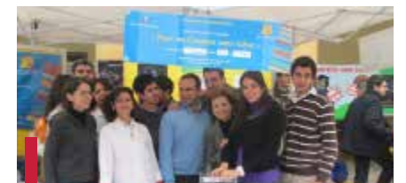
Lancement de la campagne « Université sans tabac ».

La clinique des jeunes du CUSFC a été lancée en janvier 2005 et le site infosantejeunes.usj.edu.lb en mars 2008. En novembre de la même année, l'UNFPA (Fonds des Nations unies pour la population) sollicite le CUSFC