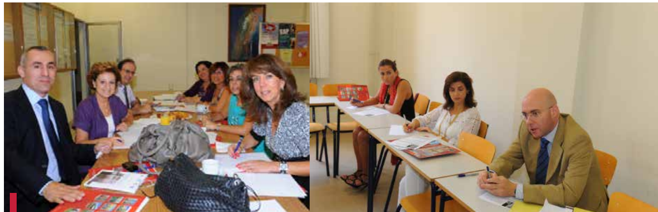
Préparation de la synthèse des ateliers de réflexion.