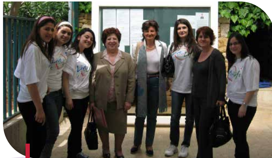
Les étudiants-volontaires et enseignants de l'École sociale à la Journée mondiale de l'Hémophilie.

Depuis la création de l'O7 en 2006, les cellules ont établi de nombreux partenariats avec plusieurs types d'organisations nationales et internationales : ONGs, ambassades, ministères, etc. Découvrons dans ce dossier les principaux partenaires des cellules de l'O7.