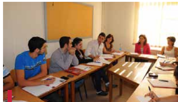
Atelier de réflexions sur la façon d'améliorer la communication et la visibilité de l'O7.