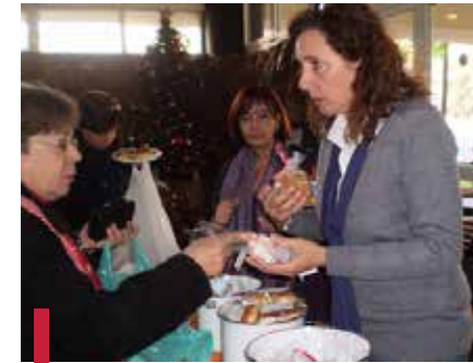
Vente de cakes.

Cette année aussi, l'Institut libanais d'éducateurs (ILE) était actif au niveau de sa Cellule enfance et éducation. Un « cakesale » a été organisé durant la semaine du « souk de Noël » au profit de trois associations caritatives : Centre AL MAJAL, Missionary of Charity Mother Theresa, et Lebanese association for Deaf and Blind. La Cellule a pu acheter un matériel éducatif pour les enfants malvoyants et malentendants et des produits d'hygiène et de consommation pour les deux autres institutions que les étudiants leur ont offert à la veille de Noël. De plus, leur action s'est étendue tout au long de l'année, par l'animation d'activités pédagogiques auprès de ces trois centres. Dans une même perspective, l'Institut libanais d'éducateurs a entrepris, trois projets communautaires éducatifs au niveau du centre AL MAJAL et de deux autres associations : Oumnia qui fournit des soins médicaux et