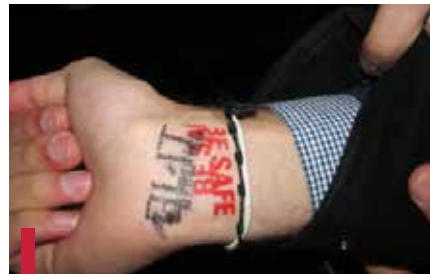
Un tampon « BE SAFE » a été posé sur le poignet des participants.