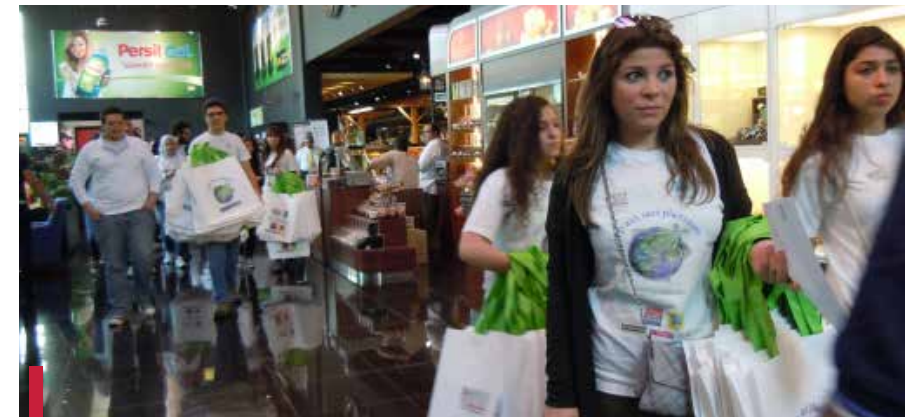
Les bénévoles de « Stop aux sacs en plastique » au supermarché.