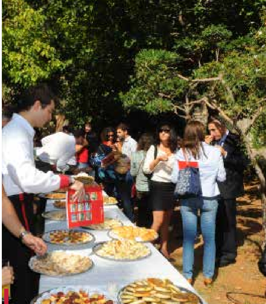
Cocktail dans les jardins du Campus des sciences médicales.