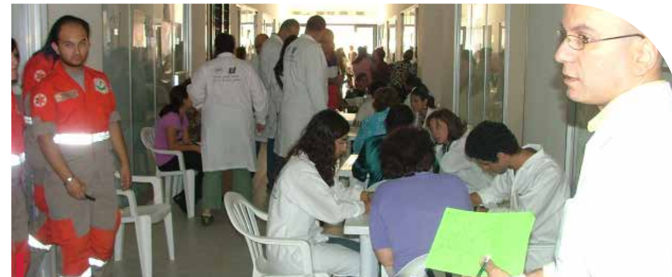
Activités de l'Hôtel-Dieu de France au Sud du Liban.