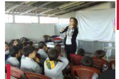
Séances : « La sécurité à l'école et à domicile ».

Dans le cadre des activités de prévention auprès des adolescents et des jeunes, le CUSFC a organisé les 5, 6 et 7 mai 2011 le « 9 e séminaire francophone international promotion de la sécurité et prévention des traumatismes » autour du thème « jeunes et passion du risque : à quel prix ? ». Trois jours durant, plus de 70 chercheurs libanais et francophones, dont 20 venant de pays francophones, ont débattu des stratégies les plus à même de protéger les jeunes contre les accidents de la route, les accidents sportifs, la violence, le suicide et les risques liés aux nouvelles technologies de l'information et de la communication. Lors de ce séminaire, le représentant de l'Organisation mondiale de la santé (OMS) à Genève a lancé la « décennie d'action pour la sécurité routière 2011-2020 ». Plus de 400 personnes ont participé au séminaire. Divers secteurs étaient représentés : les ministères de l'Éducation et de l'Intérieur, la Direction générale des forces de sécurité intérieure, des municipalités, des éduca-