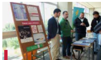
La collaboration entre le Centre et Tobacco Free (TFI) a commencé en 2003 et a repris en 2006-2009 et actuellement dans le cadre du projet « Campus sans tabac ».

Depuis août 2007 avec la municipalité de Ghobeiri : la collaboration a commencé à travers un projet financé par « l'Agence de santé publique de Barcelone (Espagne) » et le « Bureau des cités et gouvernements locaux unis » (BCGLU) au sujet de l'élaboration d'un projet intitulé : « renforcement du service municipal de santé communautaire à Ghobeiri (Banlieue