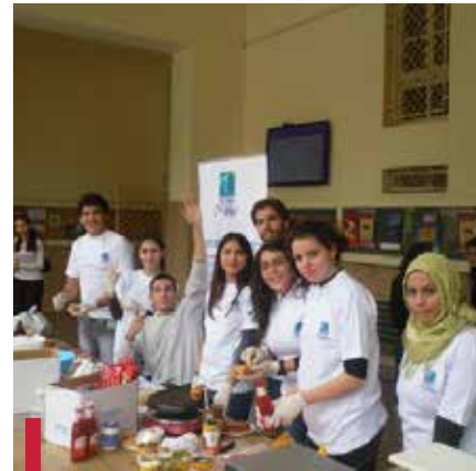
Vente de cakes.