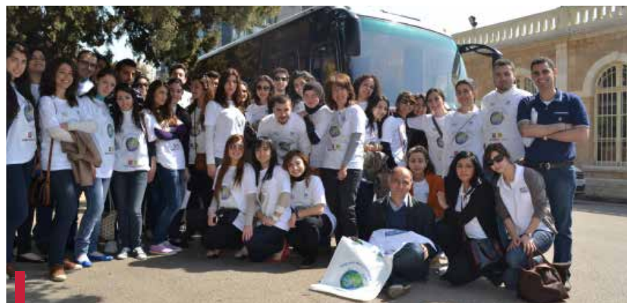
Les bénévoles de la campagne « Stop aux sacs en plastique ».

Chaque année, plus de six millions de sacs en plastique sont distribués au Liban et finissent dans la nature où chaque pièce se dégrade au terme de 500 ans. À cet effet, une centaine d'étudiants de l'USJ, issus de filières spécialisées en environnement et santé se sont rendus au Monoprix (Jnah), au Spinneys (Hazmieh), et