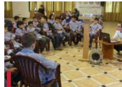
Séances « prévention des maux de dos chez les enfants »

TFI » au Campus des sciences médicales (CSM). Par ailleurs, une enquête a été menée par les « Carabins de 2 e et de 3 e année de la Faculté de médecine » sur l'usage du tabac au CSM. Près de 600 questionnaires ont été distribués aux étudiants des Facultés de : médecine, médecine dentaire, pharmacie, nutrition et laboratoire, entre mars et avril 2012. 402 réponses ont été collectées et analysées. Les résultats de cette enquête sont encourageants et reflètent le désir des étudiants d'avoir un campus sans tabac. Il convient actuellement de prendre des mesures administratives pour mettre en application cette nouvelle loi surtout les campus de l'Université.