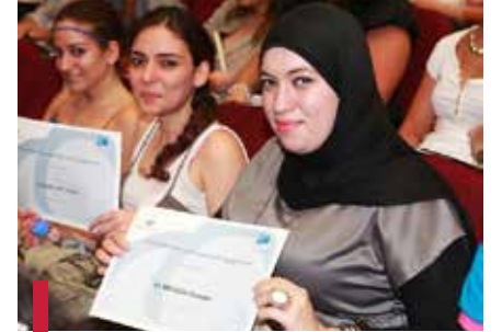
Les étudiants bénévoles de l'USJ.