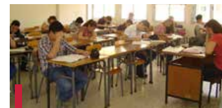
Examen pour évaluer les connaissances.

À raison d'un engagement de deux heures par semaine, les étudiants volontaires ont choisi les matières dans lesquelles ils peuvent aider les élèves demandeurs, dont certains se sont présentés plusieurs jours par semaine. Les sujets des examens officiels de plusieurs années ont été principalement travaillés pendant ces séances ainsi que des exercices sup-