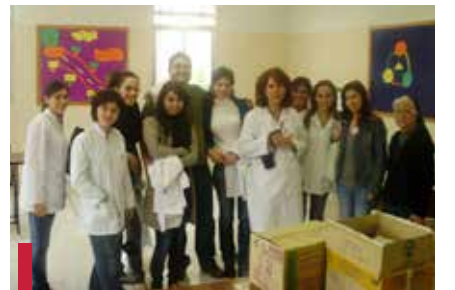
École gratuite des Sœurs des Saints-Cœurs Daroun.

- Promotion de la santé bucco-dentaire avec plusieurs écoles privées et l'association Dar Al Awlad qui se sont occupées de l'organisation et du transport.