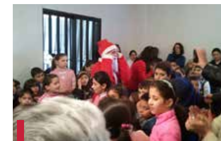
Déjeuner offert aux enfants à l'occasion de la fête de Noël.

Les consultations au dispensaire de Jdeideh Roueissat sont assurées par les résidents de médecine de famille durant toute l'année. De même, des consultations à Marsa (un centre qui propose des services de prise en charge des maladies sexuellement transmissibles) sont poursuivies à raison de deux demi-journées par semaine. En avril 2012, le Département a organisé une journée porte ouverte portant sur la prévention primaire des maladies cardiaques, durant laquelle un dépistage des dyslipidémies a été offert ainsi que des consultations de prévention. Enfin, une visite scolaire a été effectuée au début du mois de mai à Baskinta