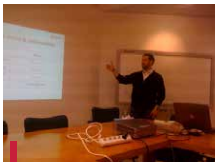
Un participant présente son projet social au jury.

Suite au lancement officiel de la compétition « Global Social Venture » ou « GSV » le 21 octobre 2010 au Liban, l'USJ et Berytech, en partenariat avec l'ESSEC, soutiennent les jeunes entrepreneurs dans ce parcours de création d'entreprises sociales.