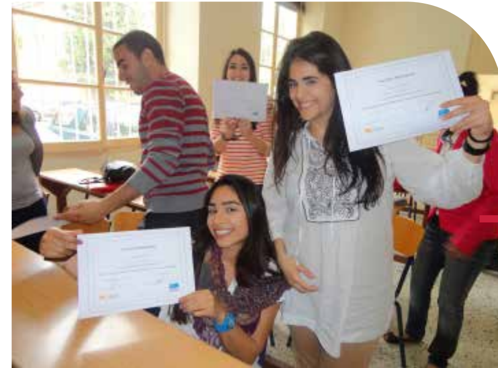
Remise d'attestations aux bénévoles de l'USJ pour avoir participé au projet intitulé : « un espace de dialogue entre les jeunes sur les drogues et les addictions » ; un projet organisé par la Faculté de pharmacie en partenariat avec l'association Skoun.

Boward Karagheusian est une ONG présentée dans 5 pays (USA, Grèce, Turquie, Syrie, Liban) ; elle s'occupe des enfants et familles appartenant à des communautés et des religions différentes.