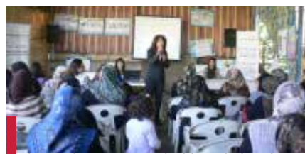
L'hygiène dentaire par N. Mouchayekh - Faculté de médecine dentaire.

En janvier 2012, un 4 e projet (avec l'adhésion d'un nouveau partenaire, l'UNICEF) est signé, toujours dans le but de partager l'expertise du CUSFC dans le domaine des services de santé auprès des adolescents et des jeunes. Ce projet s'intitule « Expanding Reproductive Health in School Based Extra-Curricular Education (Piloting) Youth Friendly Services in service delivery points ». Il consiste à aider sept centres de santé de 1 ère ligne du MS et MAS situés dans différentes régions du Liban, à mettre en place et/ou consolider des services de santé « amis des jeunes » ou « Adolescent and Youth friendly services », en assurant d'une part la formation aux agents de santé et au personnel socio-éducatif travaillant auprès d'adolescents et de jeunes et en aidant, d'autre part, ces centres à développer tous les moyens logistiques et organisationnels nécessaires pour fournir ces services en veillant toujours à associer les jeunes à tous les niveaux. Ce projet devrait prendre fin en décembre 2012.