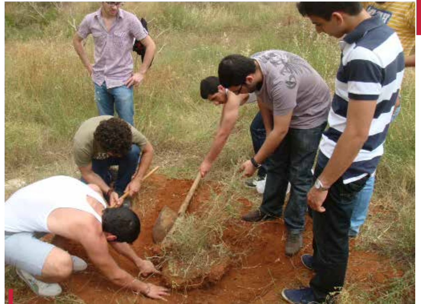
Participation à des manifestations et foires grand public.

tance, son utilité et sa fragilité est présentée en s'attardant sur le contexte libanais. Un atelier sur la reconnaissance des divers conifères du Liban préparé et animé par les étudiants a également accompagné la tournée.