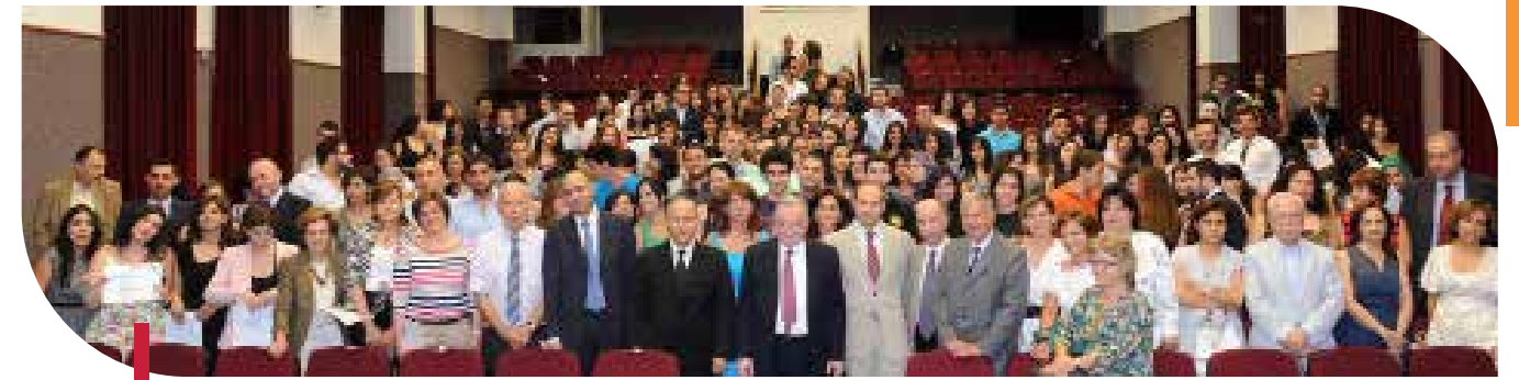
Responsables et étudiants bénévoles de l'USJ.

Avec vous, le double objectif de l'Opération 7 e jour a été atteint : vous avez été, d'une part au service de la collectivité, mais vous avez gagné d'autre part, une expérience qui vous a enrichi au niveau citoyen et humain. Pour cette année 2011/2012, vous avez été environ 350 étudiants à participer aux activités de l'Opération 7 e jour, mais vous savez que l'USJ en compte 12000. À l'avenir, c'est à vous d'encourager vos amis à se rallier à l'Opération 7 e jour parce que, et comme vous vous en rendez compte, l'expérience qui est acquise, fera la différence dans tout ce que vous entreprendrez dans la vie, ça vous apprendra à prendre plaisir d'être au service de la société, d'être à chaque instant des hommes et des femmes, avec et pour les autres.