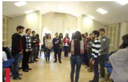
Séances de formation des éducateurs de pairs organisées par Skoun.