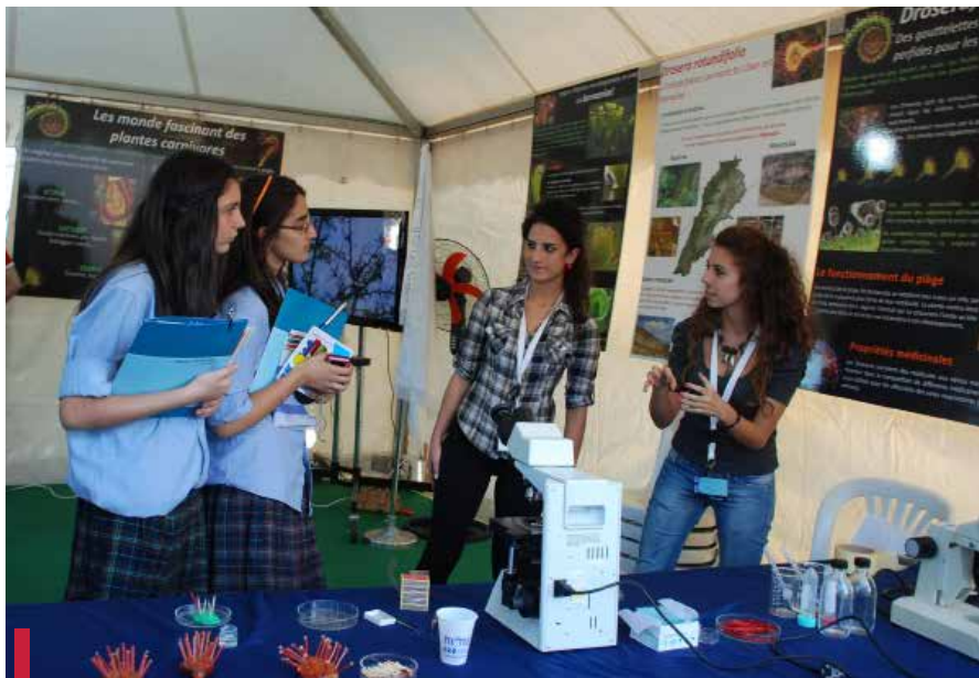
Séance de sensibilisation au Lycée de Jbeil.

Cette année aussi, la Cellule reforestation de l'O7 a cherché à mettre en avant le volet biodiversité qui existe dans les forêts libanaises mais également la biodiversité en général en s'appelant Cellule reforestation et biodiversité. Plusieurs activités ont été conduites dans le but de sensibiliser encore et toujours les libanais appartenant à différents classes d'âges, à différents milieux sociaux, ruraux et citadins à la biodiversité et à l'importance des forêts. Chaque activité constituait une occasion pour les inviter à mobiliser pour la préservation de ces forêts.