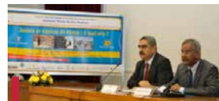
Dr Thamin Siddiqi, représentant de l'OMS au Liban et Dr Walid Ammar directeur général lors du 9 e séminaire francophone international sur la sécurité des jeunes-05 mai 2011

Depuis 2003 avec l'Organisation mondiale de la santé (OMS) : la collaboration du CUSFC avec l'OMS se situe à plus d'un niveau : - Collaboration avec le département de « lutte contre le tabagisme » depuis mai 2003. - Organisation du 9 e séminaire fran-