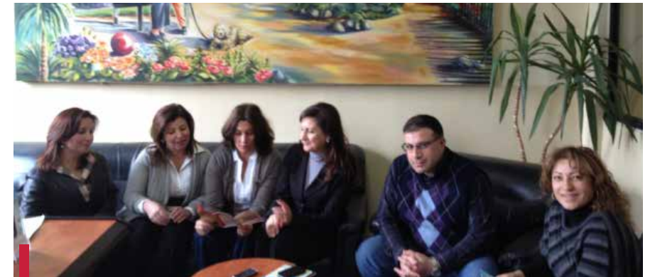
Sensibilisation à la municipalité de Tripoli.