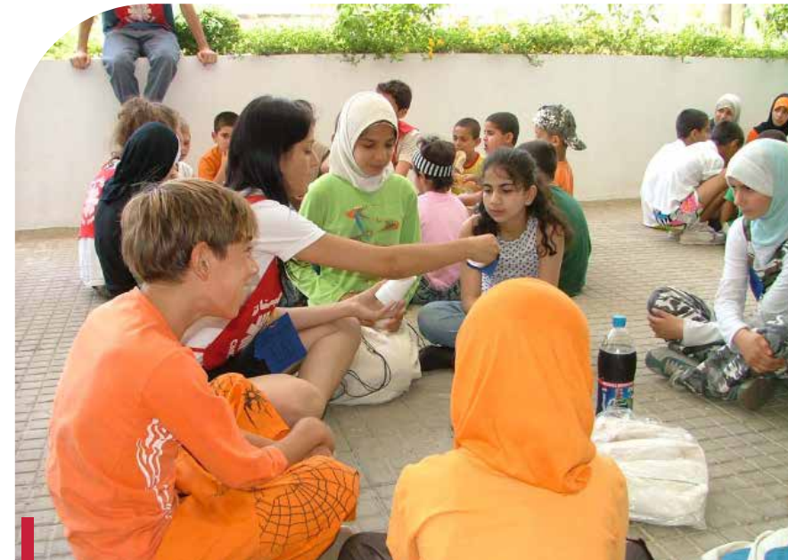
Activités à Cana.

des municipalités et de la Sûreté générale. Aussi, en octobre 2009, l'HDF a signé avec le Service de coordination et d'action culturelle (SCAC) de l'ambassade de France , un protocole de financement selon lequel, le Fonds social de développement français a accordé à l'HDF une subvention destinée à couvrir les dépenses des missions de l'O7 initiées par l'HDF. Le montant de la subvention a été crédité sur deux versements, après présentation de l'HDF d'un rapport détaillé des missions et d'une justification des dépenses et acceptation de la SCAC. La subvention a été utilisée pour le financement des interventions de prévention et de dépistage de maladies chroniques et de soins primaires des populations à fort besoins sanitaires et sociaux, notamment, dans les prisons auprès des personnes incarcérées et des mineurs.