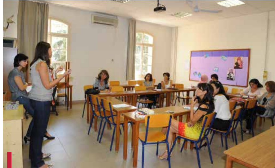
Mise en commun des différentes ONGs.

surtout les réseaux sociaux (Facebook, Twitter, etc.).