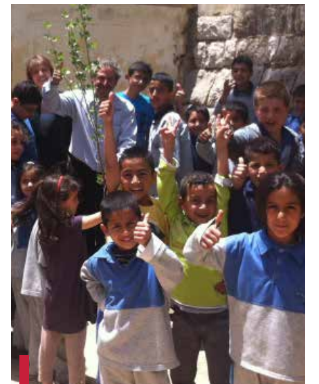
Visite d'une école publique à Mtein.