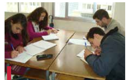
Les étudiants lors d'une session de soutien scolaire.

Le succès de ce projet pilote a permis d'envisager de répéter l'expérience l'année prochaine, sur une plus grande échelle, en intégrant un nombre supplémentaire d'écoles, et en étalant le projet sur l'année universitaire. Plus d'étudiants et d'enseignants volontaires devront alors s'impliquer.