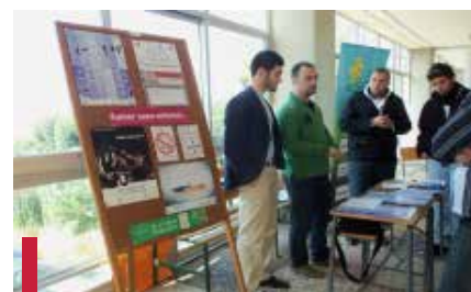
Journée « Campus sans tabac ».

plus de 20 articles et des dossiers ont été publiés sur le site en arabe et en français portant sur la sécurité et la santé des jeunes.