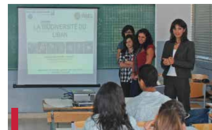
Sensibilisation à la biodiversité dans les écoles.

Depuis le lancement de l'Opération 7 e jour en 2006, l'Hôtel-Dieu de France (HDF) a mené 42 missions qui ont impliqué 900 volontaires et dont ont bénéficié plus de 3600 personnes. Les missions étaient organisées en collaboration avec les autorités locales (civiles, religieuses ou pénitentiaires) ou les ONG ( Caritas , Mouvement Social ) sur le terrain, surtout que les missions dans les prisons nécessitent des autorisations officielles du ministère de l'Intérieur,