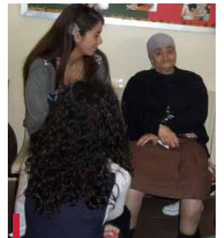
Personnes âgées de Ain-El-Remmaneh.

personnel, fait des achats de matières premières, afin de les distribuer aux personnes en besoin. Afin d'aider davantage les personnes âgées, l'ISO a également mis en place un projet de « banque alimentaire », suite à la proposition de certaines étudiantes bénévoles. Ils s'agit de collecter des matières premières (aliments et produits hygiéniques), chaque mois, puis de les déposer à l'association. Ces produits sont ensuite distribués aux personnes âgées qui sont prises en charge par l'association. Bien que les étudiantes en orthophonie soient sensibilisées au monde du handicap et du 3 e âge, il leur a fallu un peu de courage pour participer à ces activités avec elles. C'est surtout grâce à la présence de jeunes bénévoles de l'association qu'elles ont pu s'intégrer, et au fur et à mesure, chanter, jouer et même danser dans une ambiance de solidarité, d'empathie et de compassion.