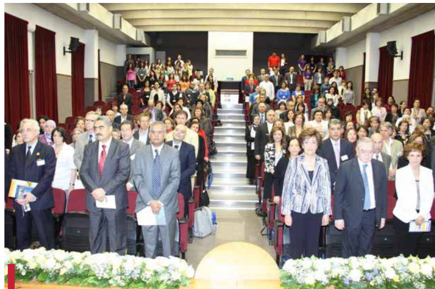
Séance inaugurale du 9 e séminaire sur la sécurité des jeunes organisé par le CUSFC et le Réseau francophone.

Dans le cadre de l'O7 et à l'issue de la journée du 15 octobre 2011 « État des lieux et perspectives d'avenir de l'O7 », le CUSFC a organisé l'opération « Université sans tabac », en collaboration avec Tobacco Free Initiative (TFI). Cette opération vise à renforcer la responsabilité sociale des étudiants et à les associer à des activités au service de la collectivité. Un plan d'action et des objectifs ont été définis pour inciter les étudiants à l'action en vue de la mise en œuvre de la nouvelle loi anti-tabac (n° 174) tant au sein de l'Université que dans leur vie privée, à activer la protection des fumeurs passifs à l'Université, à renforcer la vigilance quant aux méfaits de la cigarette et notamment du narguilé, à aider les fumeurs qui souhaitent arrêter de fumer. Ainsi, cinq journées de portes ouvertes ont été organisées entre octobre 2011 et avril 2012, comportant plusieurs activités dont le test CO, le test de dépendance à la nicotine, le quiz sur la nouvelle loi, l'échange cigarettes-chocolats, la compétition gonflement de ballons, la prise de photos dans un cadre spécial « anti-tabac », l'information et la distribution de brochures préparées par le CUSFC à cet effet (la nouvelle loi 174 ; le narguilé, etc.) et la signature d'une pétition pour « un campus sans tabac » (près de 400 signatures recueillies le même jour). La 1 ère journée a eu lieu le 14 décembre 2011 au Campus des