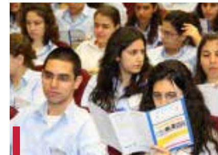
Beaucoup de jeunes ont participé au 9 e séminaire.

La visite médicale a été assurée auprès de 800 élèves des classes primaires avec la constitution d'un dossier médical adapté. L'éducation à la santé s'est concrétisée par une trentaine de séances d'information auprès des élèves, des parents et des éducateurs relevant de ces écoles et par la production d'une dizaine de brochures informatives. Cette activité a sollicité la collaboration d'autres instances de l'USJ, le Centre anti-poison de la Faculté de pharmacie, le Département de dentisterie communautaire de la Faculté de médecine dentaire et l'Institut de physiothérapie. La sécurité et la salubrité de l'environnement à l'école ont fait l'objet d'une étude observationnelle avec l'émission de recommandations notamment au niveau de la sécurité des sorties et des entrées scolaires et de l'existence d'un eau potable dans les écoles. Cette activité a nécessité la mise à jour d'un « répertoire des institutions spécialisées pour enfants de 0 à 18 ans » regroupant des informations concernant plus de 130 institutions.