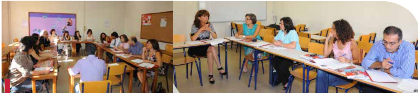
Ateliers de réflexion en vue d'améliorer cet engagement civique qu'est l'Opération 7 e jour.

6 ans déjà ! Juillet 2006, le Liban est en guerre, l'USJ s'engage à travers l'Opération 7 e jour (O7). Au bout de 6 ans d'action civique, vient le moment de faire une mise au point, d'établir un état des lieux pour essayer de structurer et de pérenniser cet engagement ; chose faite le 15 octobre 2011 au Campus des sciences médicales de l'Université.