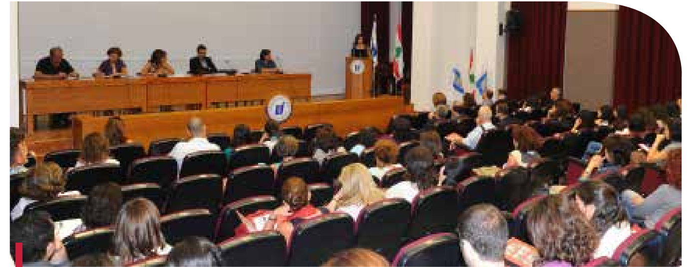
Annonces des résultats de la synthèse des ateliers de réflexion.

liser les étudiants au bénévolat et à la citoyenneté, et de valoriser le concept de l'engagement civique au niveau institutionnel, personnel et social.