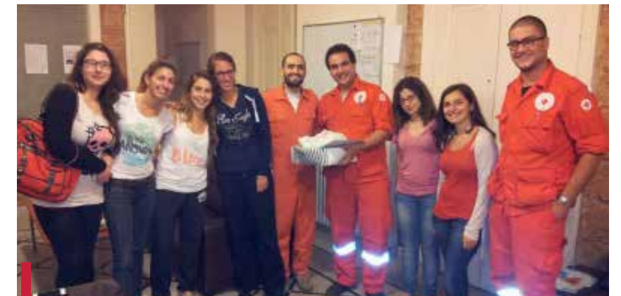
Les étudiants du Département de sociologie et d'anthropologie avec la Croix Rouge.

Les étudiants de 3 e année du Département de sociologie et d'anthropologie ont organisé une vente de gâteaux le 23 mai 2012. La somme récoltée a été donnée à la Croix Rouge.